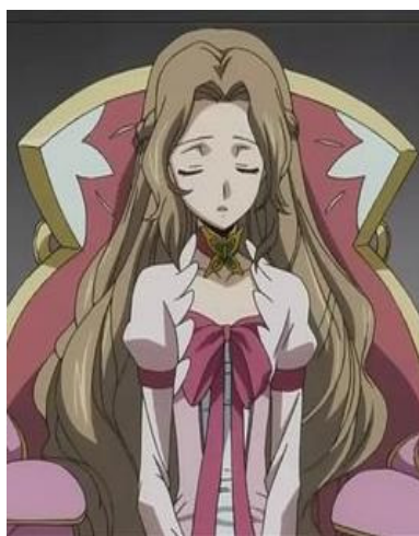
圖五 娜娜莉·蘭佩洛基

魯路修的妹妹，也是第 87 順位的皇位繼承人。年幼時因捲入母親暗殺事件之陰謀，而失去了視力與行走能力。之後與哥哥一同被作人質前往日本。娜娜莉是片中少數稱日本人為「日本人」的不列顛尼亞人，性格善良。