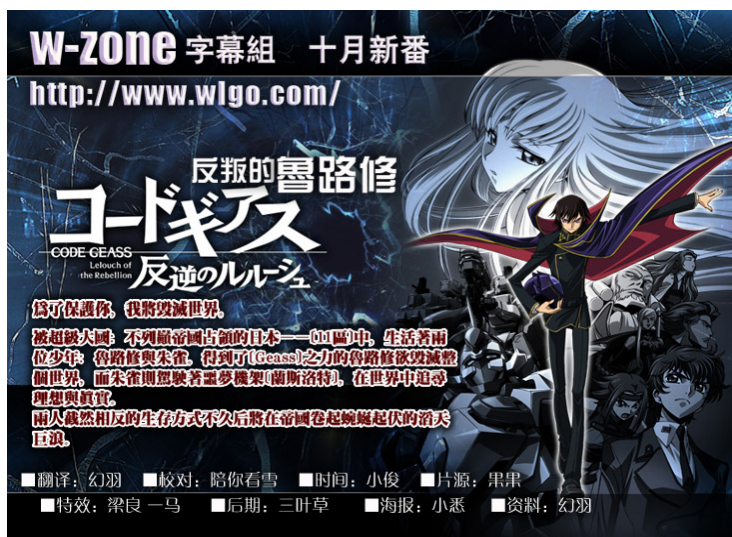
圖 1 :反叛的魯路修

動畫目前一共有二季，從 2006 年 10 月開始播出至 2007 年，接續的系列《Code Geass 反叛的魯路修 R2》從 2008 年 4 月開始播出，為現在日本最熱門的連載動畫之一。