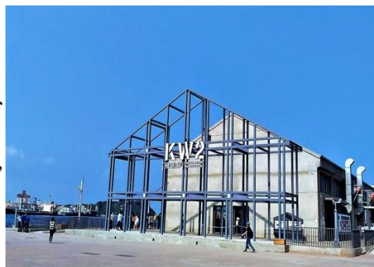
圖 7 棧貳庫

位於鼓山區七賢路底、高雄港 2 號碼頭的「棧貳庫」前身為日人於大正 3 年(1914)在新濱町岸壁興建之磚牆瓦頂單層小型倉庫，用以儲存、輸運砂糖為主，迄今已有 104 年歷史。具有建築史及技術史上之意義，現況地景與老倉建築仍能看出其原扮演之鐵路轉海運的樞紐角色，見證台灣經濟蓬勃起飛的榮景，高雄市政府於 2003 年公告為歷史建築。