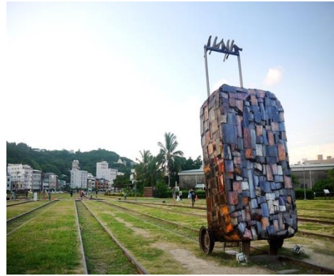
圖 8 哈瑪星鐵道文化園區

原為高雄港站，是高雄第一個火車站，為高雄當時開啟了海陸聯運的發展。這邊的鐵道古蹟保存狀況十分完整，是全臺灣唯一可以進行動態復駛的百年火車站。而在打狗鐵道故事館外，則有重新規劃的廣大綠地，全區面積達到 12 座足球場。綠地中可到一見墩十分耀眼的天空雲台，是由有 38 年歷史的紅色路橋改建而成。哈瑪星鐵道文化園區，也成為高雄居民及外國遊客的最愛。