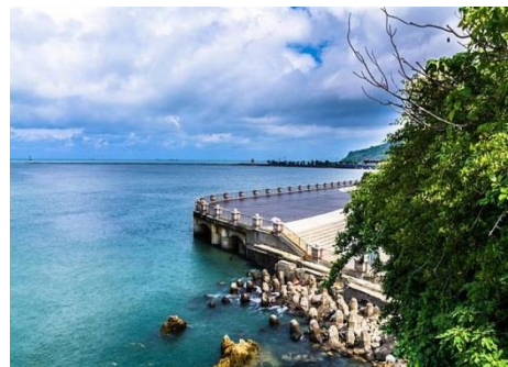
圖 10 西子灣

西子灣以夕陽美景及天然礁石聞名可觀海景、遠眺高雄港；海水浴場極富熱帶氣息、南國風情，每當夜幕低垂，晚霞的照耀，漁船燈火閃爍其間，呈現海天一色美景。西子灣的西子夕照為高雄八大勝景之一，每到日落時分，沿著海岸護堤的石砌欄杆，成為欣賞落日餘暉的最佳位置。