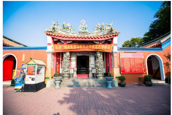
圖 1 1 十八王公廟

雄踞於高雄港入口處的山岬上，視野寬闊美麗，廟宇建築保有傳統閩式風格，廟前為一陡峭險峻的階梯。傳聞意在考驗信徒「無誠勿登」。根據廟內石碑記載，清康熙年間有 18 位中國商人跨海渡台由現今西子灣上岸墾荒，卻被視為叛民集體革殺，附近居民感念 18 位先民的精神，就收斂遺體集中收納祠堂供祭，此為王公廟最早起源。