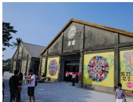
圖 5 駁二藝術特區

由老倉庫改建而成，其主要結構分為四部分：有適用於大型展演的「駁二 P2 倉庫」，以及適合小型作品展覽用途的「C5 台糖倉庫」，還有專用於表演的「月光劇場」，以及作為社區市民休憩場所、藝術市集的「藝術廣場」。整體呈現後現代的設計風格，且為了讓藝術氣息能夠融入整個市民生活中，高雄駁二藝術特區也將不定期的展演藝文活動，提供藝術家一個創作發表的藝文展館。