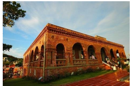
圖 9 英國領事館

英國領事館的設立源於清咸豐八年(1858)年，英法聯軍後，中國簽訂不平等條約，同治二年(1863)列強迫使台灣開放港口，當時的英國商人在台灣通商口岸設立洋行，用來輸入鴉片及輸出米、茶及糖，同治四年(1865)在打狗港口的哨船頭小丘上設立領事館，處理關稅及商務。