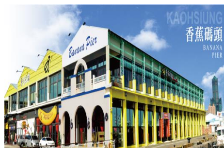
圖 6 香蕉碼頭

「香蕉碼頭」原名為「香蕉棚」，位置正對高雄港第一港口，擁有依山傍海的好環境和獨特的地理位置，50 年代臺灣香蕉大量出口日本，為提昇香蕉品質及因應香蕉生產數量遽增，於民國 52 年，在三號碼頭擴建了一棟雙層香蕉棚，除了配合早期裝置香蕉竹簍之堆疊方式，主體建築的柱距較為密集，且採用露天方式建造，為高雄港唯一一座開放式的倉庫。