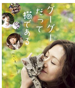
圖四：大島弓子 グーグーだって猫である 1996年

畫家麻子忙於工作的同時，陪伴多年的貓咪卻過世了。幸好她又遇到另一個生命中的天使——咕咕。