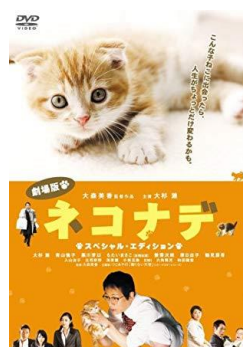
圖五：亀井亨 ネコナデ 2008年

司的宿舍裡，不但對貓咪疼愛有加，還拿了公司的監控機器人讓他可以24小時看到小虎。