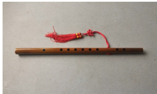
圖 3. 吹管樂器 — 直笛