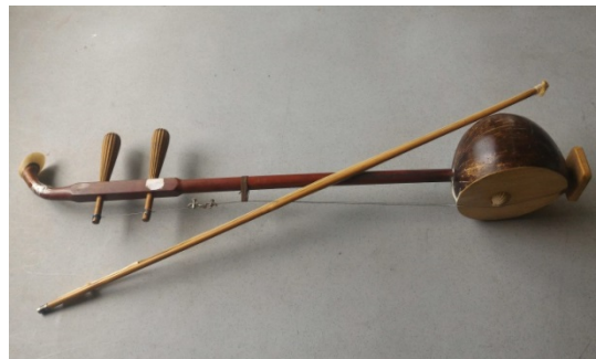
圖 5. 弦樂器 — 胡弦