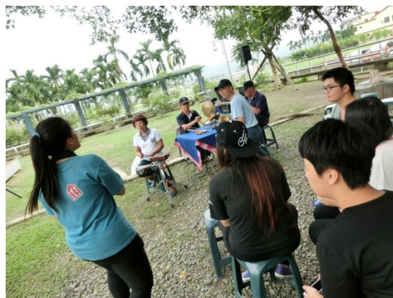
圖 13. 組員於 2015/11/1 在客家文物 博物館聽客家八音演奏

因為六堆地區客家八音傳習方法上的特殊，它的傳習就會出現「代溝」與「障礙」。對於六堆客家八音的延續傳承與再生，都是最大的隱憂，不久的將來，客家八音有可能會消失在客家人生活的環境之中。而隨著時間流逝，會八音演奏的專業老師，不是逐漸變老，就是已故；而有心學習客家八音的人群是少之又少，導致會演奏客家八音樂器的人逐漸變少。但是在美濃的幾個地區，