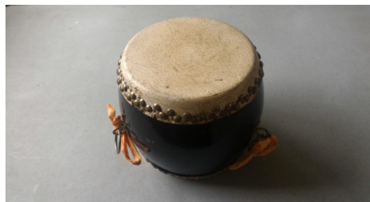
圖 7. 鑼鼓樂器 — 堂鼓