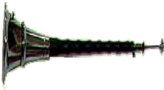
圖 2.吹管樂器 — 嗩吶