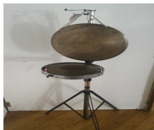
圖 10. 鑼鼓樂器 — 調鑼(大鑼) 座鑼(小鑼)