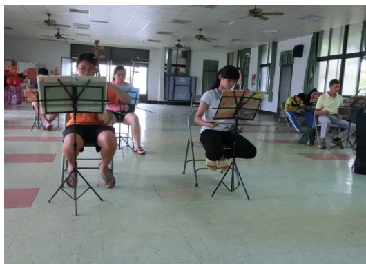
圖 12. 組員 2015/11/1 在社區活動中心 參訪美濃客家八音班練習