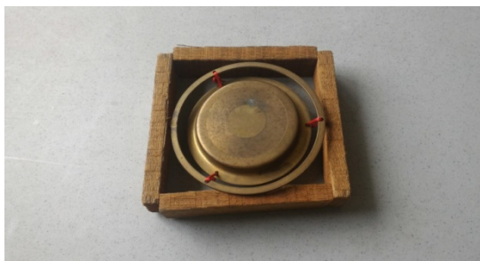
圖 6. 鑼鼓樂器 — 小錚鑼