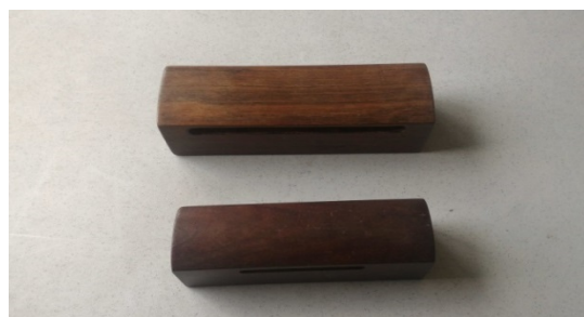
圖 9. 高音響板&低音響板