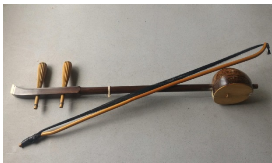
圖 4. 弦樂器 — 二弦