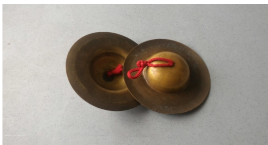
圖 8. 鑼鼓樂器 — 小拔